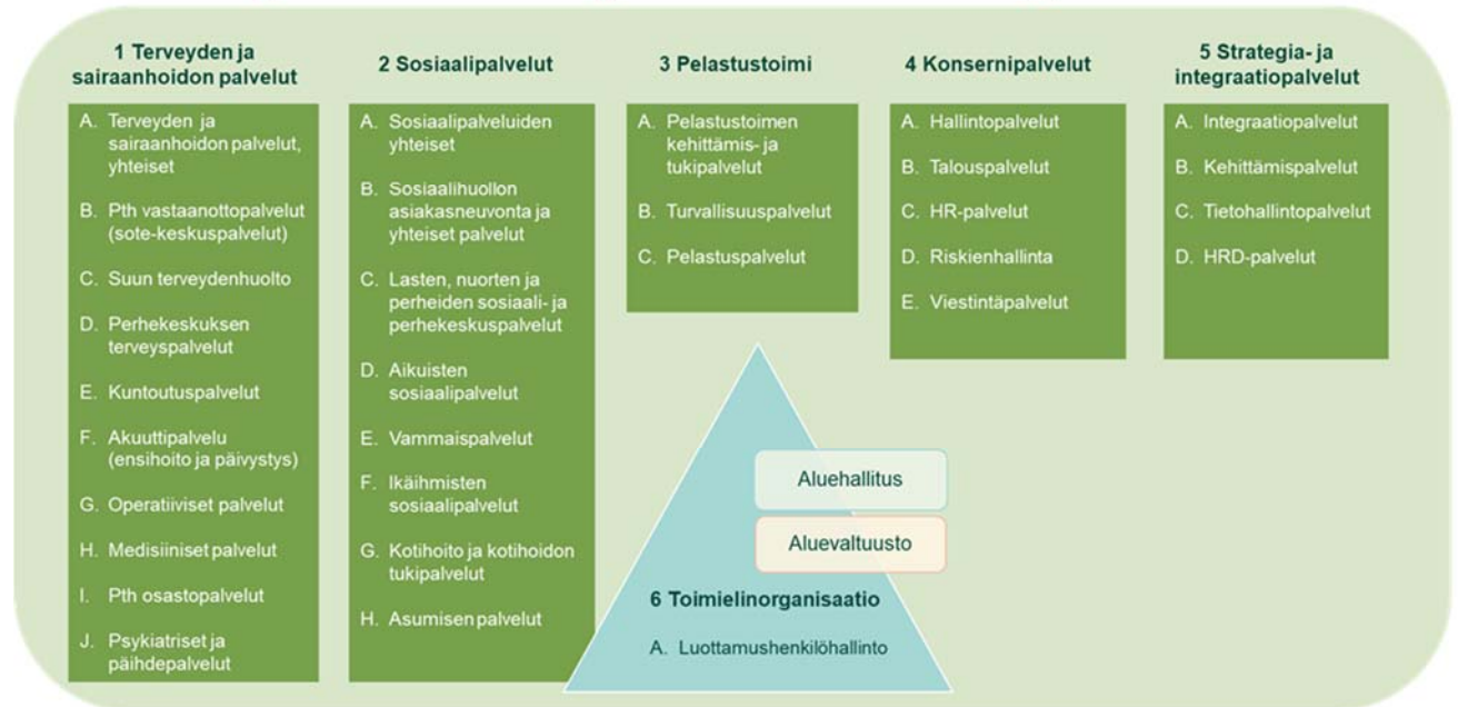
Kuva 4. Kymenlaakson hyvinvointialueen toimialat ja tulosalueet