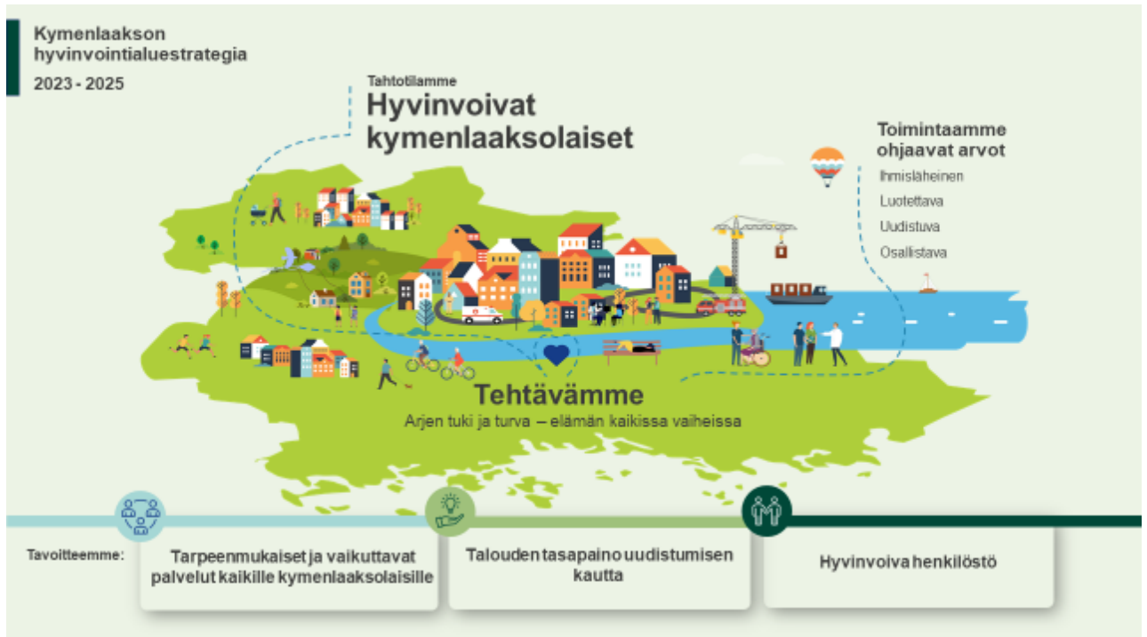
Kuva 1. Hyvinvointialuestrategiakokonaisuus

Palvelustrategiassa on kuvattu alueen sosiaali- ja terveyspalvelujen erityispiirteet sekä palvelulupaus kymenlaaksolaisille ”Olemme sinua varten: oikea-aikaisesti, turvallisesti ja palvelutarpeesi huomioiden”. Lisäksi palvelustrategiassa määritellään yhteiset strategiset linjaukset, jotka ohjaavat sosiaali- ja terveydenhuollon palveluidemme toteuttamista.