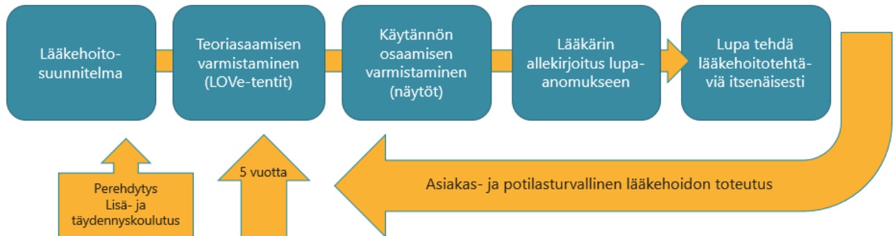
Kuva 2. Esimerkki lääkehoidon osaamisen varmistamisesta Kymenlaakson hyvinvointialueella

Osaamisen varmistaminen sisältää perehdytyksen, tarvittavan lisä- ja täydennyskoulutuksen, teoriaosaamisen varmistamisen, käytännön osaamisen varmistamisen ja lääkelupamenettelyn. Lääkehoitoon osallistuvan henkilöstön tulee päivittää lääkehoitoon oikeuttava lupansa viiden (5) vuoden välein täydennyskoulutuksella (LOVe-verkkokurssit tentteineen) ja antaa osaamisestaan näytöt. Lääkehoidon osaaminen varmistetaan siltä osin kuin se on sisältynyt tutkintoon ja lisä- ja täydennyskoulutuksen jälkeen vaativan lääkehoidon osalta. Toimintayksikön toiminnassa tarvittavan lääkeluvan edellytyksenä suoritettavat osaamista mittaavat teorialentit ja näytöt määritellään toimintayksikön lääkehoitosuunnitelmassa, joka pohjautuu Kymenlaakson hyvinvointialueen lääkehoitoa ohjaaviin asiakirjoihin. Erityisesti toimintayksiköissä, joissa lääkehoitoa toteuttaa mahdollisesti muutkin kuin sosiaali- ja/tai terveydenhuollon ammattihenkilöt, tulee lääkehoidon vaatimus ja lääkehoidon tehtävät, osaamisen hankkiminen ja osaamisen varmistaminen määritellä selkeästi ja yksilöidysti toimintayksikön lääkehoitosuunnitelmassa.