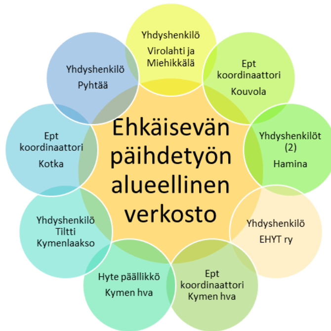
Kuva 3. Ehkäisevän päihdetyön alueellinen verkosto 2024.

Kaikissa Kymenlaakson kunnissa on nimettynä ehkäisevän päihdetyön yhdysenkilöt (Hamina, Pyhtää, Virolahti ja Miehikkälä) tai ehkäisevän päihde- ja mielenterveystyön koordinaattorit (Kouvola, Kotka). Ehkäisevän päihdetyön yhdysenkilöt ja -koordinaattorit kehittävät ja toteuttavat ehkäisevää päihdetyötä ja päihdehaittojen ehkäisyä omassa kunnassaan yhteistyössä eri toimijoiden kanssa. Jokaisessa kunnassa toimii monialainen ehkäisevän päihdetyön työryhmä.