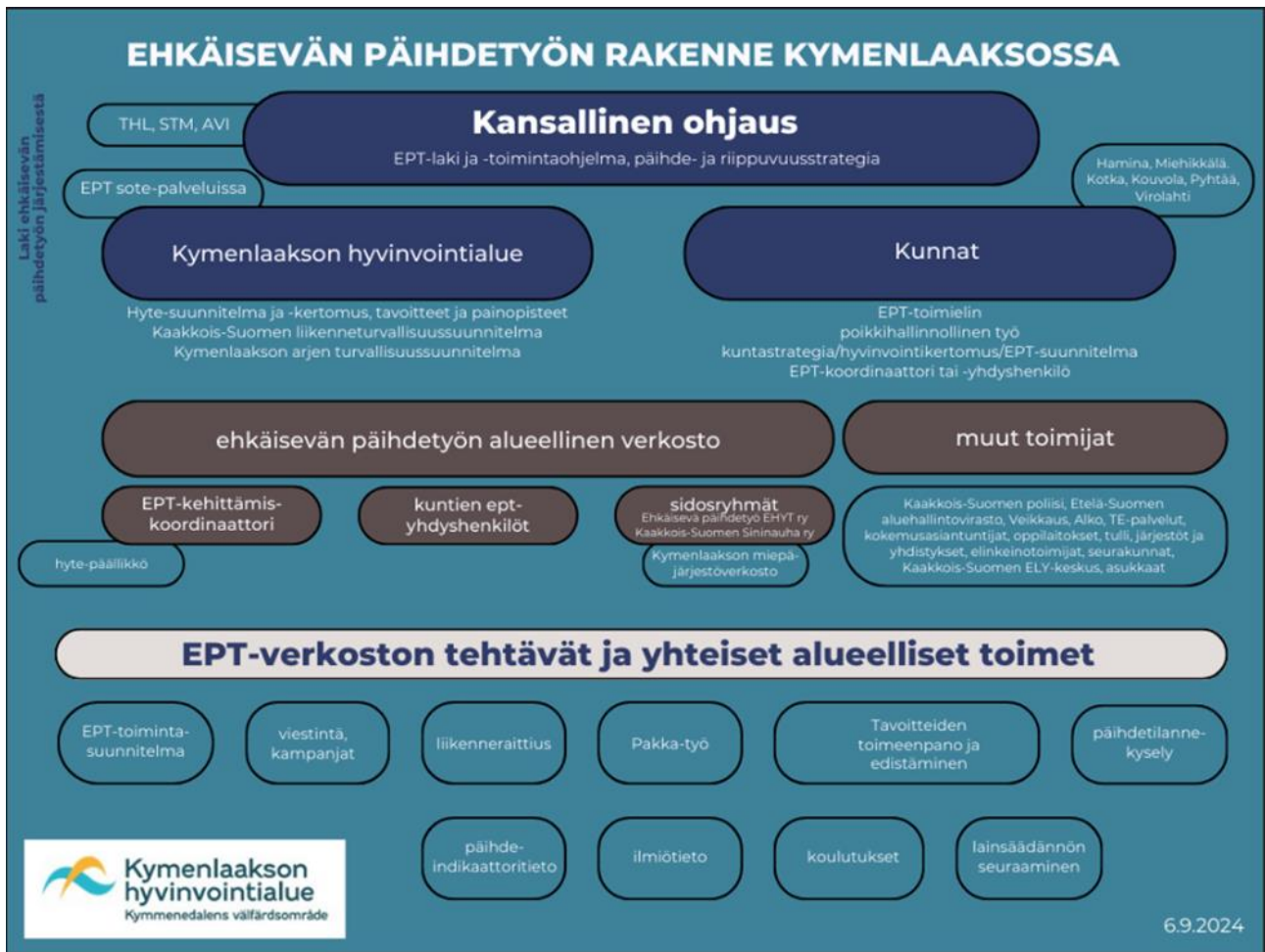
Kuva 2. Kymenlaakson ehkäisevän päihdetyön malli 2024.